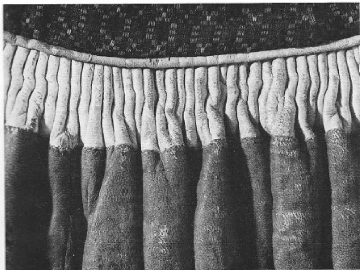
3. Detalj av midjepartiet i ryggen på skinnkjol. 1829. Lövestad, Färs hd. KM 15.408.

fram till är kjolarna mestadels släta. Den breda röda skinnvåden som kommer härnäst kantas ofta av passpoaler dvs. smala rem-sor inlagda i skarven mellan två skinn- eller tygbitar. Skinnvådens bredd varierar mellan 15–49 cm, men bredder på omkring 36–38 cm är vanligast. Resten av kjolarnas längd, som totalt håller sig omkring 79–92 cm upptas av en bred, röd vad-malsvåd.