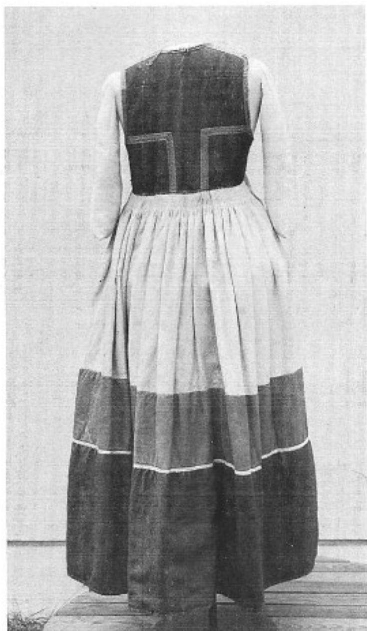
5. Livkjol med liv av röd vadmal och kjol av fårskinn. Kjolen av vitt sämskat skinn, rött skinn och röd vadmal. Skinnapplikationer på framsidan. Linnefoder. 1800-tal. Lyby, Frosta hd, Skåne. KM 8.998.

ficköppning finns många gånger både monogram och årtal inristade eller broderade.