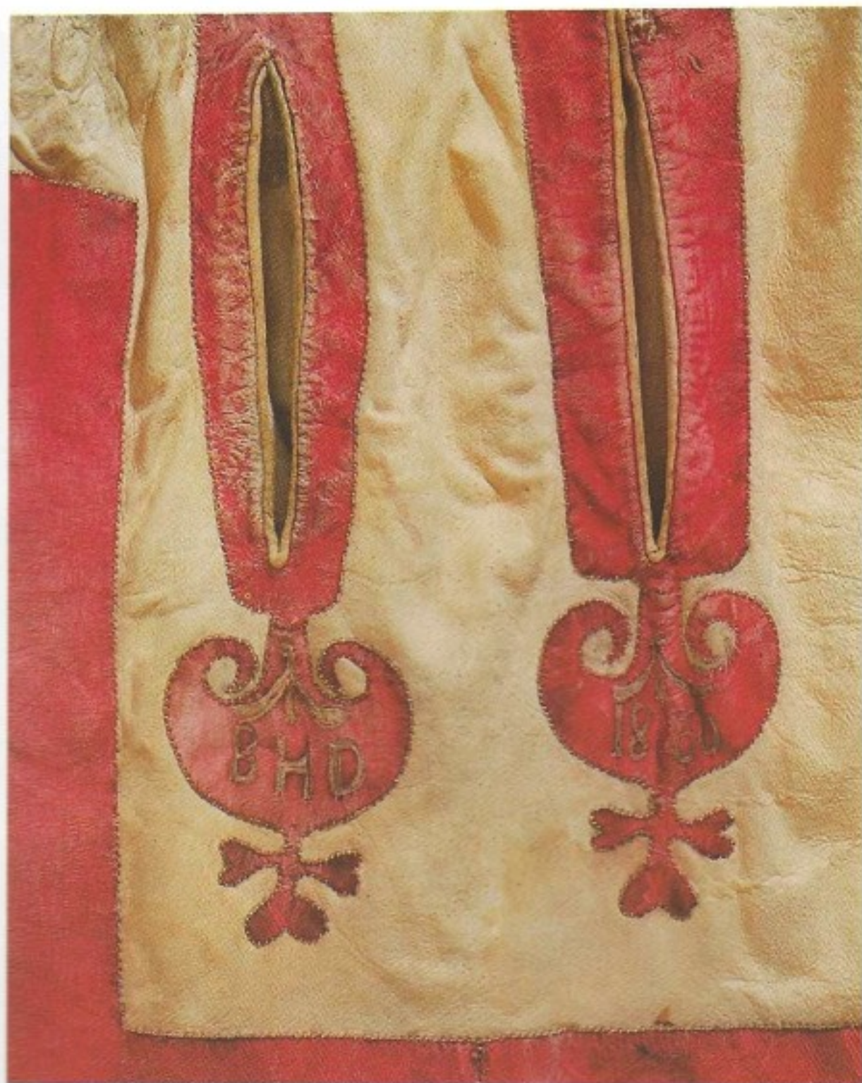
XVI Skinnkjol i vitt och rött, detalj. De hjärtformade ornamenten med inristat monogram och årtal BHD 1830 avslutar fick- och kjolsprund. Färs hd, Skåne, KM 9.239.