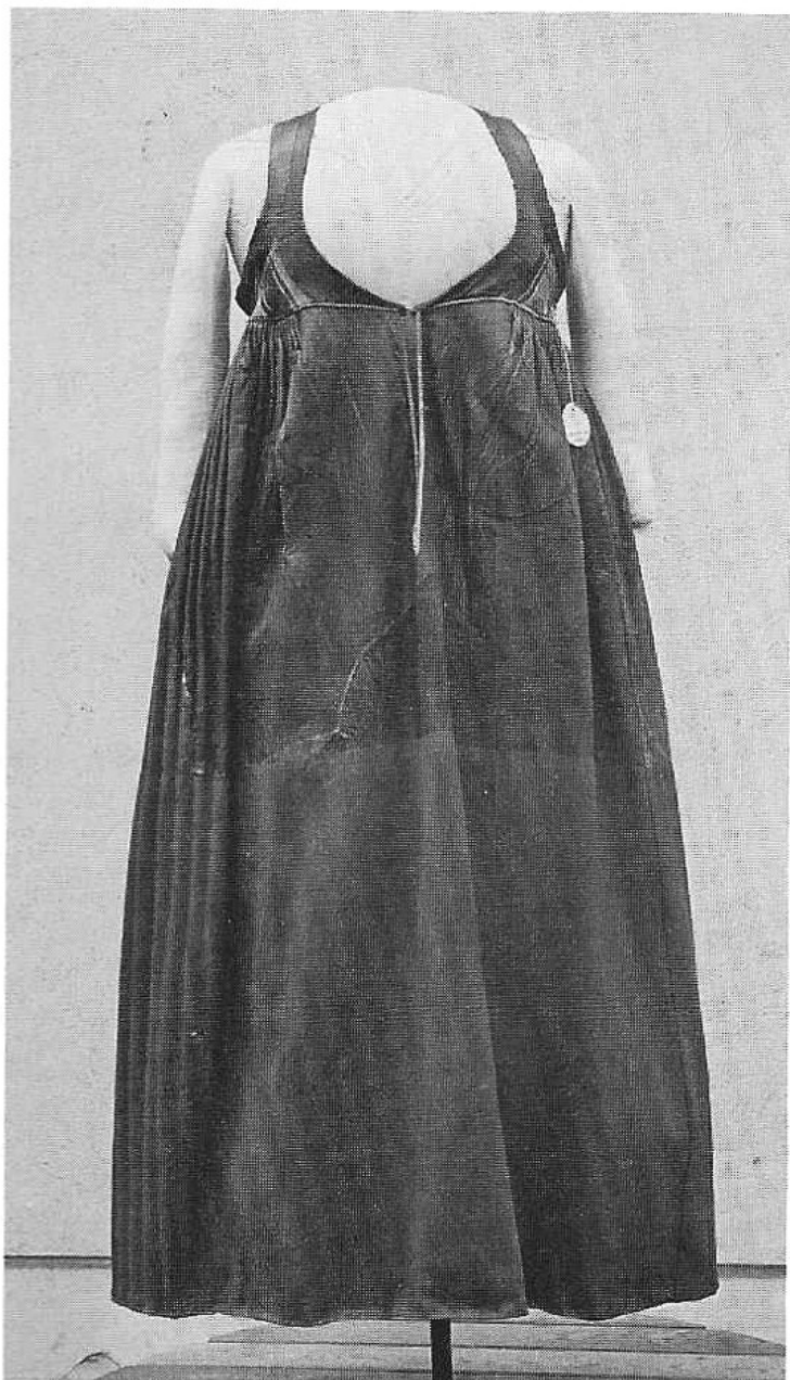
6. Livkjol med sidenliv och kjol av skinn. Kjol av rött skinn och röd vadmal med "knäppta" veck i midjan baktill. Första hälften av 1800-talet. Löderup, Ingelstads hd, Skåne. KM 2.136.

För Herrestads del skulle man kunna tro att det är en och samma skräddare som under en tjugoförårsperiod gjort alla kjolarna eftersom de sinsemellan har mycket stora likheter.