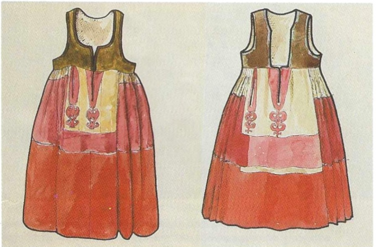
XIV–XV Skinnklockor från 1800-talets första hälft, Skåne. Överst: Vemmenhögshögs hd, 1846, KM 15.310. Hedeskoga, Herrestads hd, KM 17.659. Nederst: Tolånga, Färs hd, KM 15.132. Färs hd, 1819, KM 248. Teckningar av Märta Lindström. Skala 1:10.