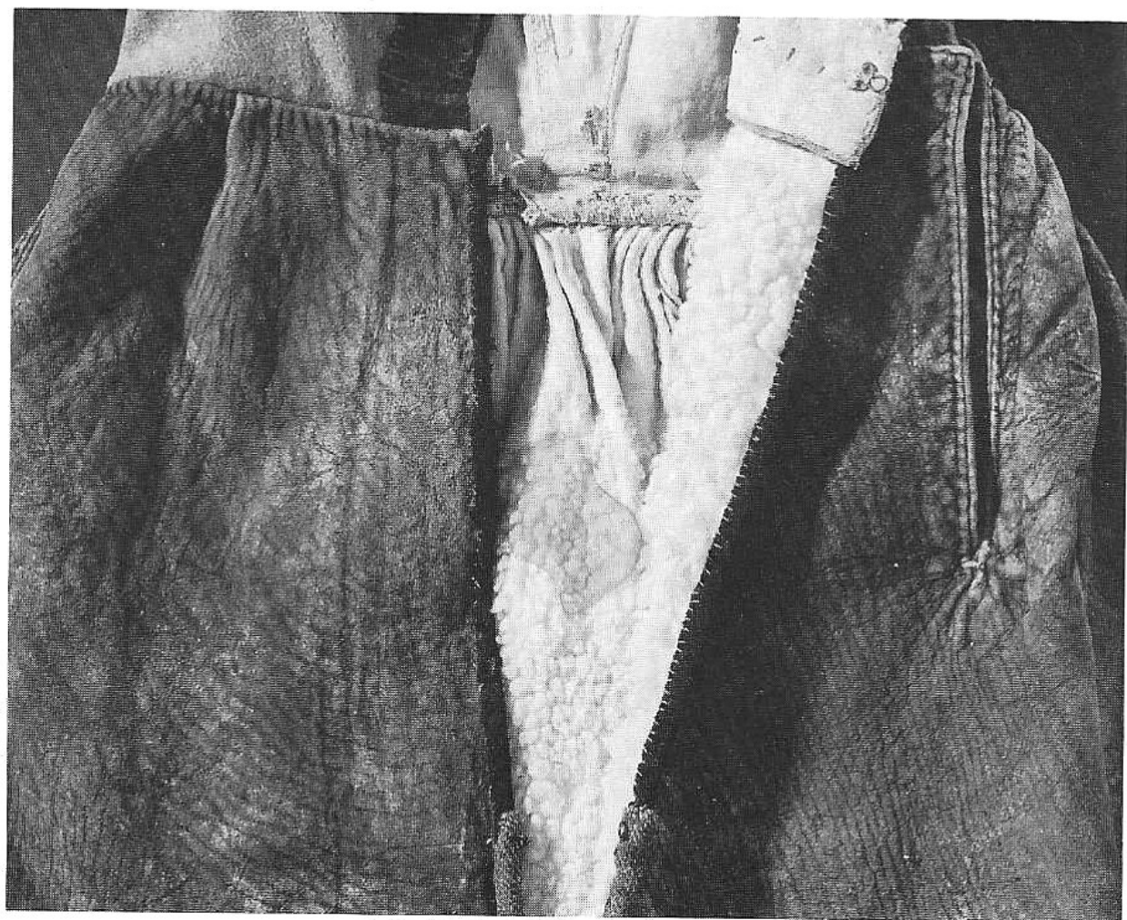
9. Detalj av skinnkjol, svartbrun med grönt vadmalsliv. I sprundet syns den smålockiga fårpälsen. Nertill är kjolen kantad med röd och grön vadmal. 1800-talets senare hälft. Huaröd, Gälds hd. KM 53.132.

De professionella garvarna satte förutom böndernas garveringredienser även till äggulor, vatten och olja. Alungarvning, s.k. vitgarvning, ansågs inte som "äkta" garvning eftersom alunet inte förenade sig med skinnen. Efter vattentvätt blev därför skinnen så gott som råa igen – de var bara konserverade. De alungarvade skinnen färgades med koschenill samt med naturliga träfärger, blåträ, gulspån och liknande. Genom att tillsätta någon syra fick man färgerna kraftigare.