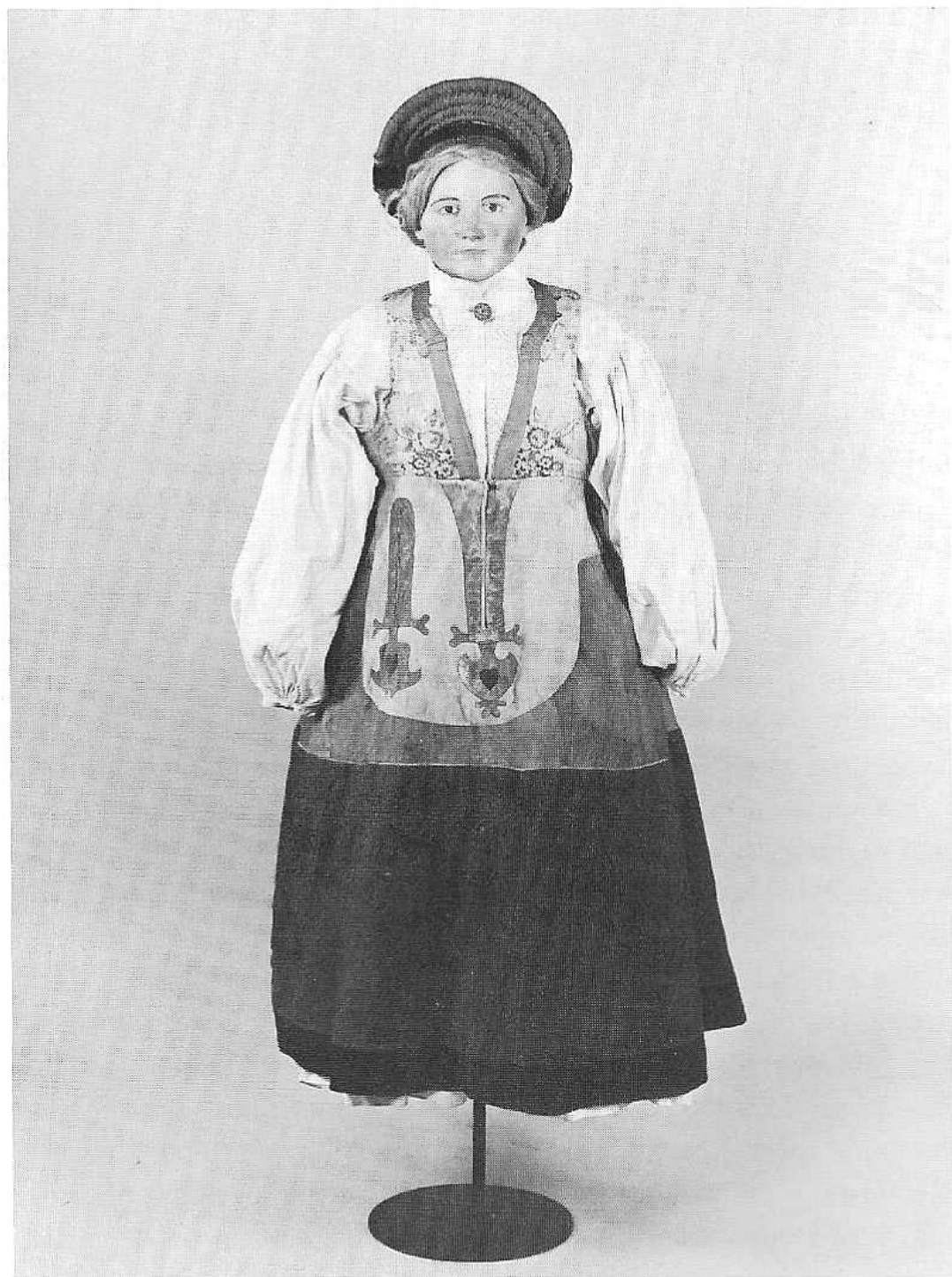
1. Dräktdocka iförd piglock, vitbroderad särk och livkjol. Kjolen av gult och rött skinn med skinnapplikationer runt fick- och kjolsprund. Nedersta våderna av röd och grön vadmal. Första hälften av 1800-talet. Möjl. Färs hd, Skåne. KM 200.