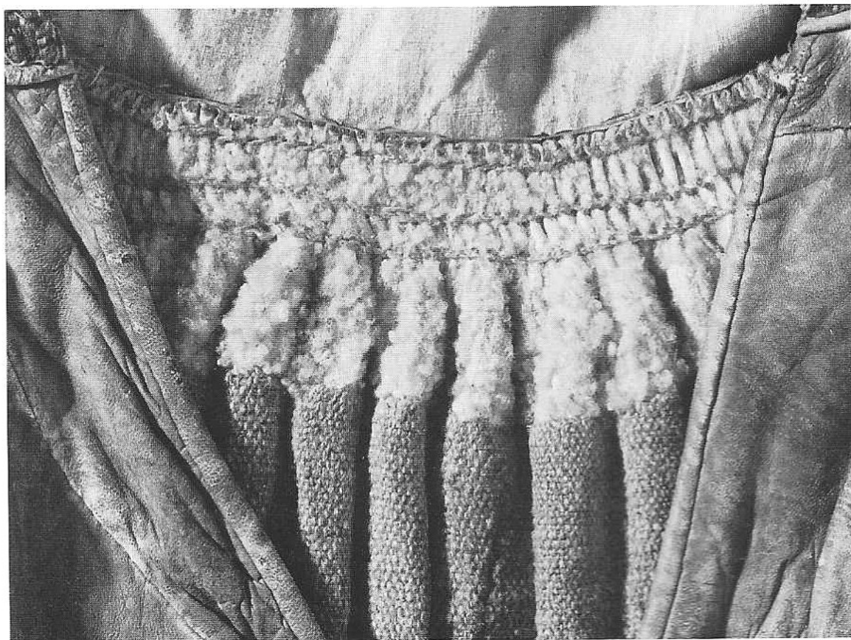
2. Detalj av skinnkjol, röd med brunmönstrat liv. I midjan syns fårskind och linnefoder samt de översydda vecken. 1829. Lövestad, Färs hd. KM 15.408.

detta skinn är af twänne slags färg utanpå” och vidare ”med denna kjortel gå qwinfolken både winter och sommar fast han är luden”. Andra skribenter har berättat om samma sorts pälskjolar från Torna och Färs härad. Som framgår av 1928 års intervjuer har de röda kjolarna funnits litet varstans i södra och mellersta Skåne.